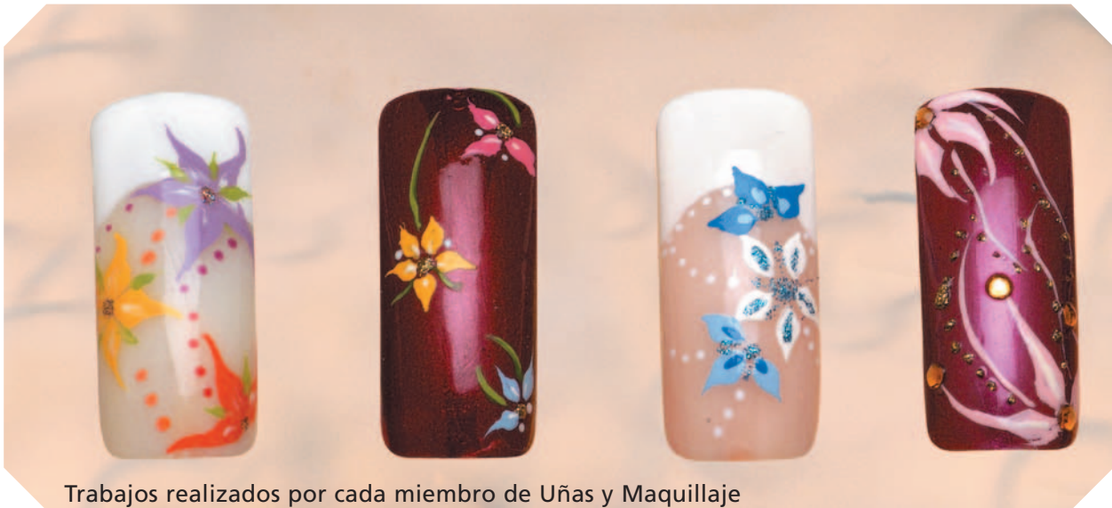
Trabajos realizados por cada miembro de Uñas y Maquillaje

No os quiero contar la odisea que sufrí, pero a punto estuvo de costarme el divorcio. Y lo peor de todo es que allí no hacían ese tipo de uñas. Supongo que la señora o no me entendió o no pensó que una turista pudiera acceder voluntariamente a ese barrio. Bueno, es una experiencia que no la puede contar todo el mundo, aunque yo me quedé con las ganas de que dibujaran un airbrush en mis uñas.